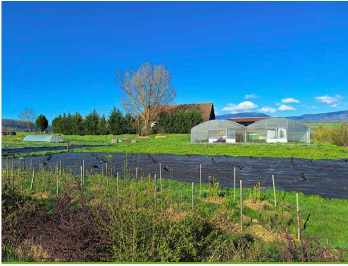
La Ferme de Lilan se situe à Bavois (VD), sur les terres noires du Nord vaudois.