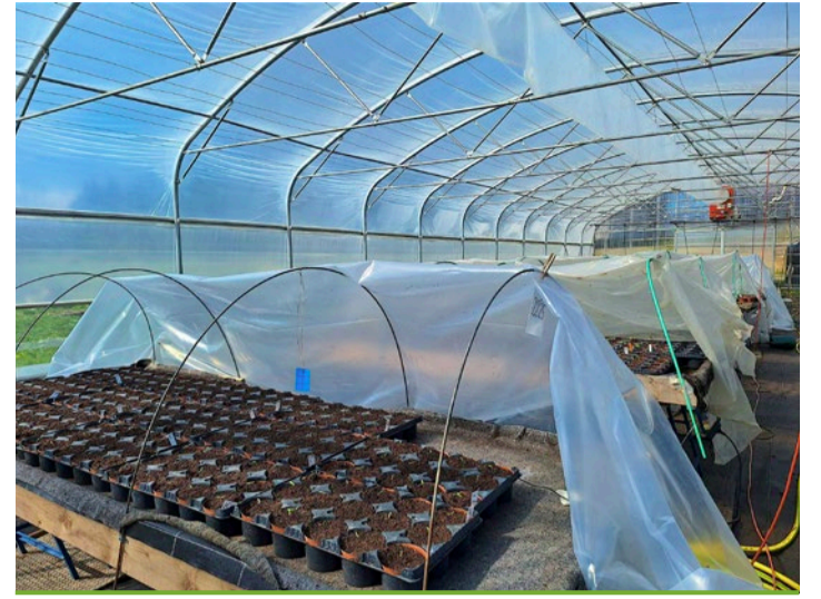
Sous plusieurs tunnels, l'exploitation produit la quasi-totalité de ses plantons.